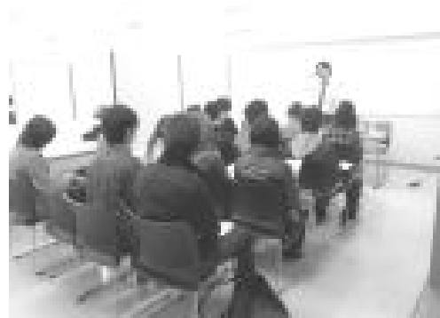
学生委員会主催のビジョンナビセミナー