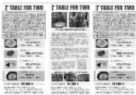
TFT 募金の取り組み報告