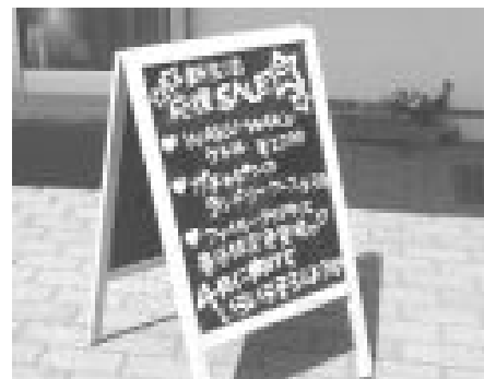
ライフセンター前のブラックボード