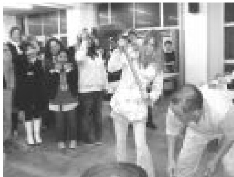
留学生との餅つき交流会 (12 月)