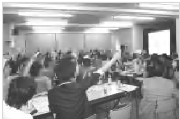
第 52 回総代会の採決風景