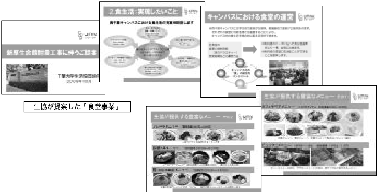
生協が提案した「食堂事業」

西千葉三食堂を効率的運営し、投資回収を早める。 西千葉食堂3店舗の事業剰余高を黒字化します。 ライフセンターを含めた3店舗（工学部店・総合校舎店）の効率的な運営を行います。 ライフセンターの品揃え棚構成の点検を行う。 今後の投資に向けて税引き前剰余高700万円を目指します。