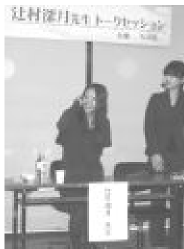
辻村 深月トークショー (12 月)