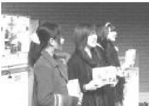
ハイチ地震募金活動 (1 月)