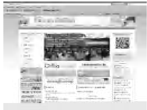
千葉大生協の新しいホームページ

学生委員会がライフセンター前でブラックボード宣伝を行い、組合員にお勧め企画を案内しました。