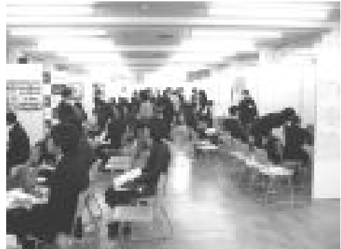
生協の就職支援セミナー

2011年度受験生向けの「大学案内」パンフレット作製に生協学生委員会が参加しました。